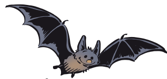
Ein Säuger im Miniformat, der fliegen kann: Wunderwerk der Natur

Nur wer nachts von Stechmücken geplagt wurde, dem könnte auffallen, dass durch die nächtliche Jagd der Fledermäuse deutlich weniger unliebsame Plagegeister unterwegs sind.