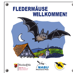
Aktionsplakette am Eingang: „Fledermäuse Willkommen!“

Sie gehören dann zu den Menschen, die nicht nur über biologische Vielfalt und Nachhaltigkeit reden, sondern auch etwas dafür tun.