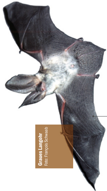
Graues Langohr

NABU Rheinland-Pfalz Postfach 1647 55006 Mainz