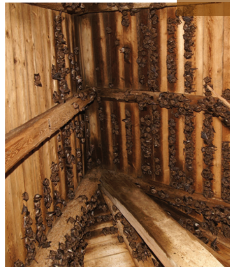
Mausohrkolonie im Dachstuhl in der Kirche St. Anna in Bacharach-Steeg

Getragen wird das Projekt vom NABU und dem rheinland-pfälzischen Ministerium für Umwelt, Forsten und Verbraucherschutz. Außerdem unterstützen die Experten des Arbeitskreis Fledermausschutz Rheinland-Pfalz die Aktion tatkräftig.